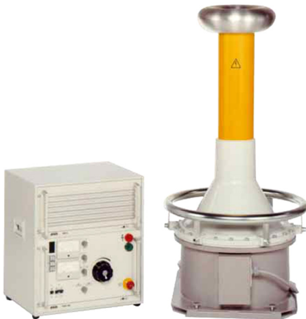
Obrázek je ilustrační.